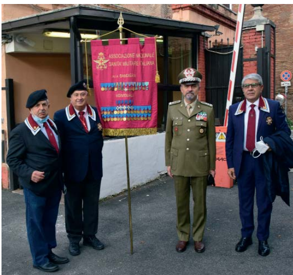
Momenti della Cerimonia in occasione del Consiglio Nazionale depositando una corona d'alloro al cippo dei Caduti della Sanità Militare nel complesso Militare di Villa Fonseca in Roma