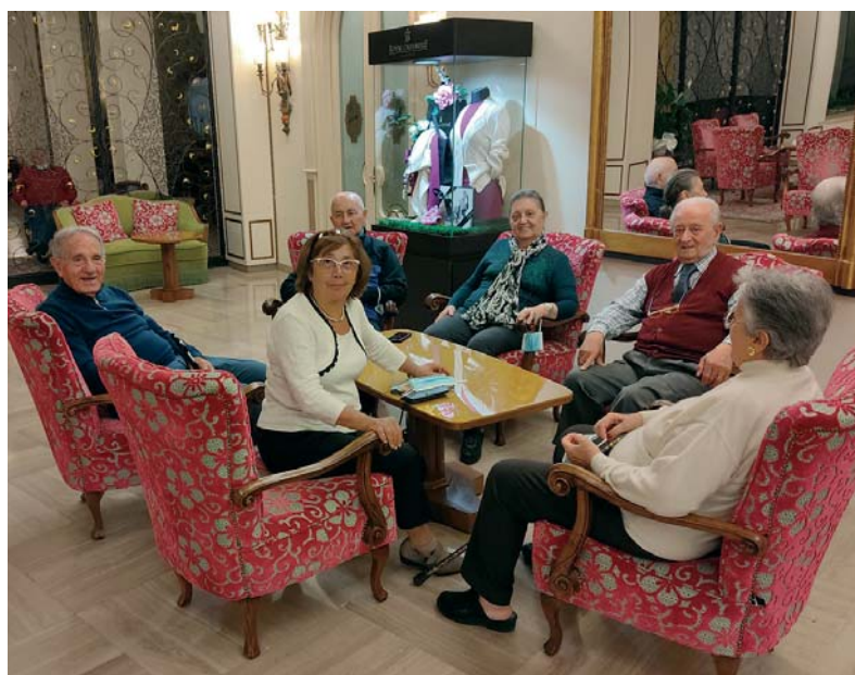
Alcuni Soci partecipanti

Ricordo inoltre che l'hotel Buja Ariston Molino praticherà uno sconto a tutti i soci che vorranno effettuare un ciclo di cure presso tale struttura. Per ottenere lo sconto i soci dovranno telefonare alla Sezione Tel. 06 7001405 – Cell. 347 9448958. La Sezione provvederà a fare la prenotazione per il socio e rilasciare un documento per usufruire lo sconto.